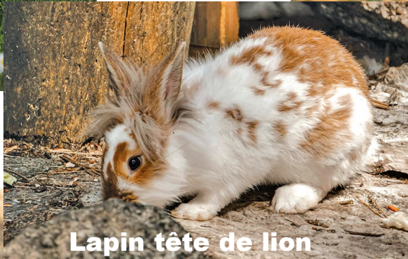
Lapin tête de lion