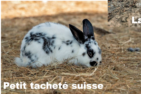
Petit tacheté suisse